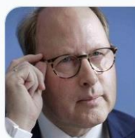
Einzelhandel fehlen Umsätze, Verdi gegen Sonntagsö... Viele öffnen, manche warten, andere verkleinern sich: Der Handel stellt sich auf die neuen Vorgaben der ... absatzwirtschaft.de