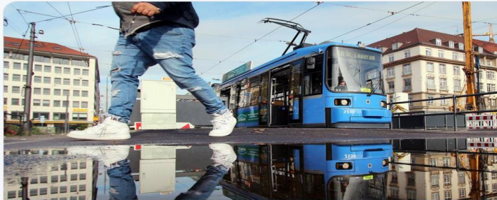
Transport: Paketlieferung mit der Tram? Teuer, aber umweltschonend Pakete per U-Bahn transportieren – mit dieser Idee sorgte Verkehrsminister Andreas Scheuer für Aufsehen. Eine Studie aus Frankfu... zeit.de

https://www.zeit.de/wissen/umwelt/2020-05/transport-studie-lieferungen-tram-umwelt-teuer