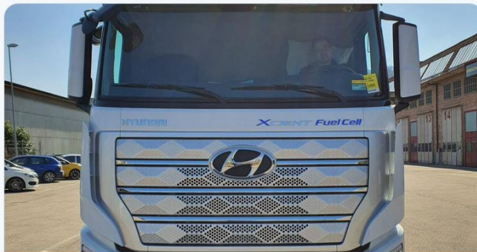
Die Vorbereitungen von Hyundai in der Schweiz: Pionierarbeit bei der Br...