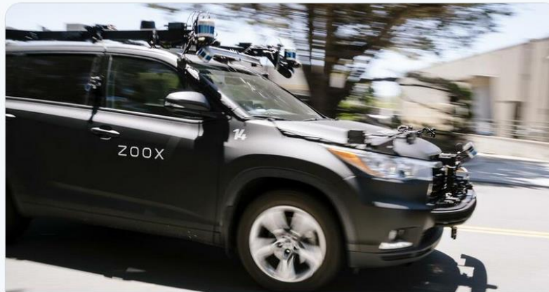
Amazon übernimmt Roboterauto-Start-up Zoox